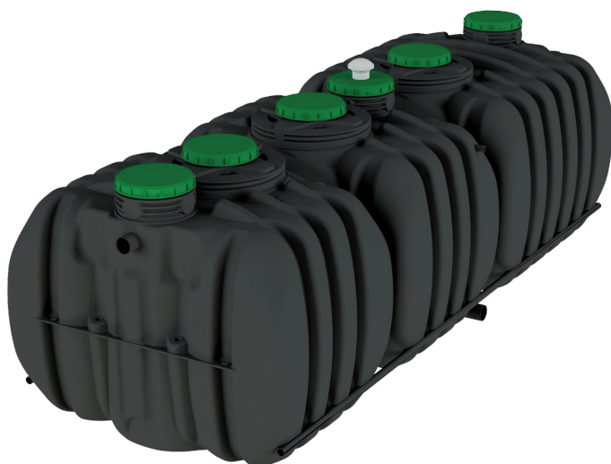
ACTIFILTREO 185 5 EH 4000