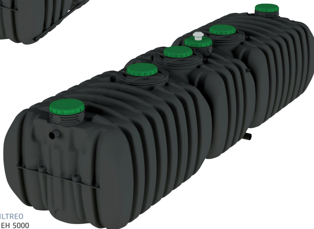
ACTIFILTREO 185 8 EH 5000