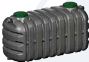
Epurbloc 119 3000