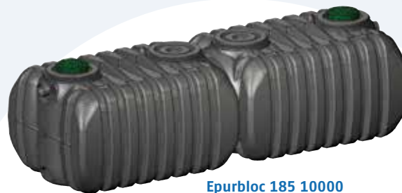
Epurbloc 185 10000