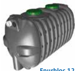
Epurbloc 122 3000