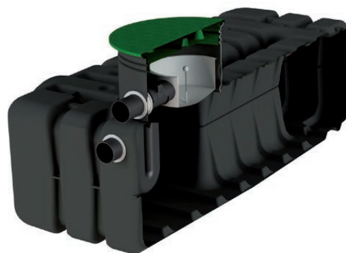
AT 70 2500 + kit pluviales FT